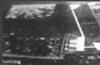
昭和6年の羽田空港