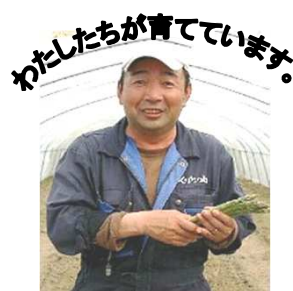
美瑛アスパラ会 植田会長